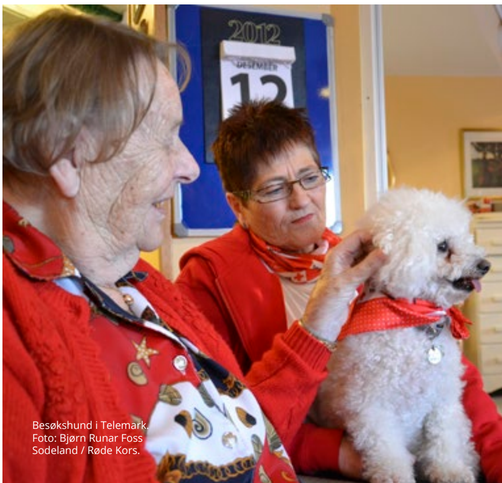
Besøkshund i Telemark.

Partene vil legge til rette for møteplasser mellom kommuner, frivillige organisasjoner, frivilligsentraler og frivillige enkeltpersoner der man gjennom dialog kan se behov og muligheter og stimulere til økt rekruttering av frivillige. Gjennom en helhetlig frivillighetspolitikk vil samspillet og samarbeidet mellom frivillig sektor og kommunen økes og ressurser kan tas i bruk på nye og innovative måter.