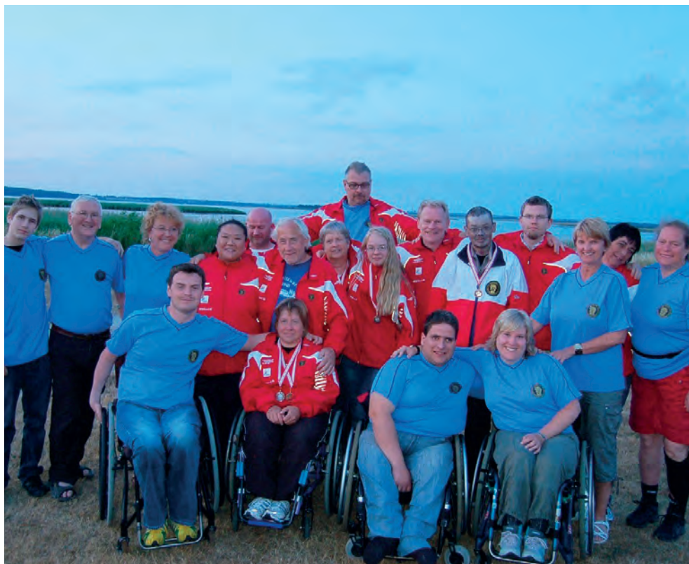
Den norske troppen som deltok på Nordisk Mesterskap i Danmark i 2009.

Det viktigste arbeidet foregår imidlertid på klubbnivå. Det er her alle skyttere får sin første trening og oppnår grunnleggende ferdigheter.