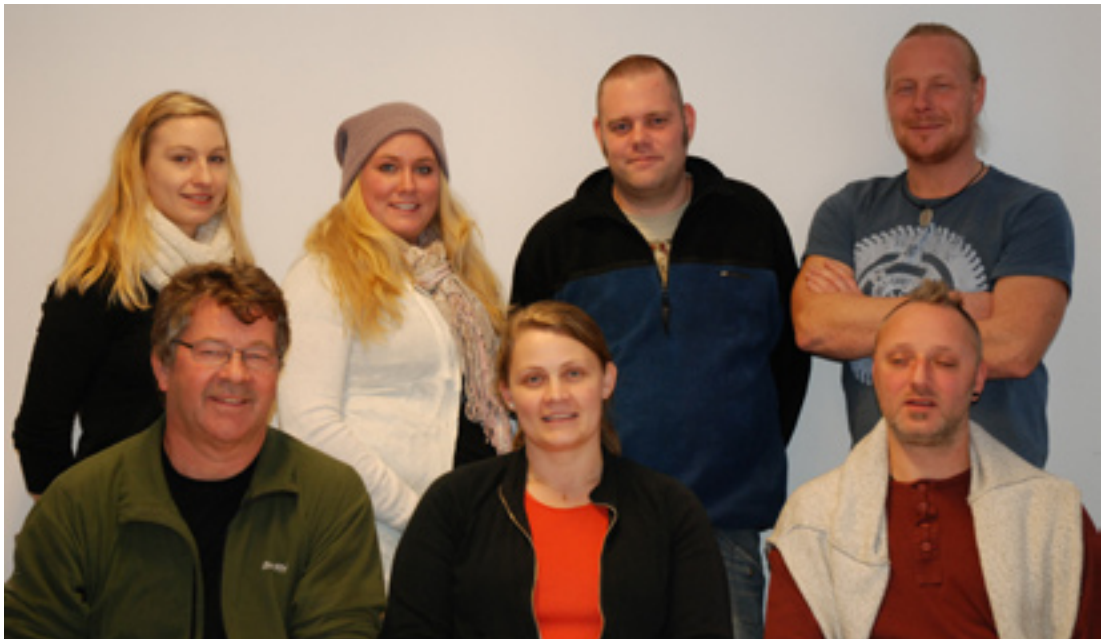
Medarbeidere i Uteteamet i Drammen

Denne foreliggende nettrapporten er imidlertid et "underveisdokument" som er et supplement til tidligere nettrapport. Dvs. at vi i dette dokumentet kun har til hensikt å oppdatere utviklingen av ideer og tanker vi har arbeidet med det siste året. Deler av dokumentet vil på denne måten fremstå som nesten utarbeidet, mens andre deler vil være i startfasen og på denne måten gi en pekepinn på hva som kommer. Hvis en ønsker seg et mer helhetlig bilde av prosjektet DELTA i Drammen så anbefales det å lese igjennom begge dokumentene som foreligger i perioden frem til sluttrapporten kommer.